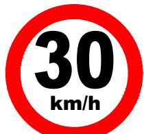
R-19 Velocidade Maxima Permitida