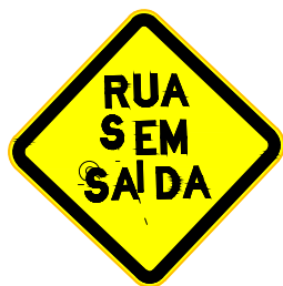
R-45 RUA SEM SAÍDA