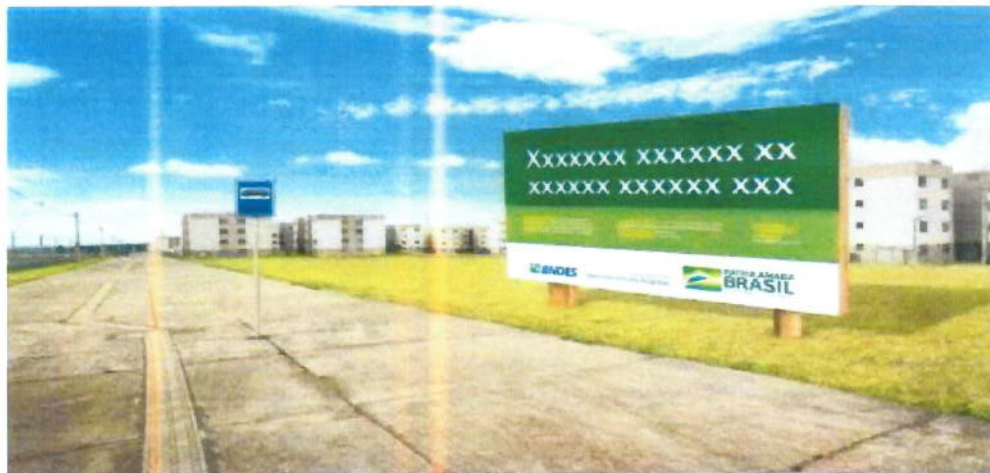
Imagem 1 – Modelo Placa de Obra

Conforme estabelecidos no site da Caixa ( https://www.caixa.gov.br/Downloads/gestao-urbana-manual-visual-placas-adesivos-obras/Manual-Placa-de-Obras.pdf ).